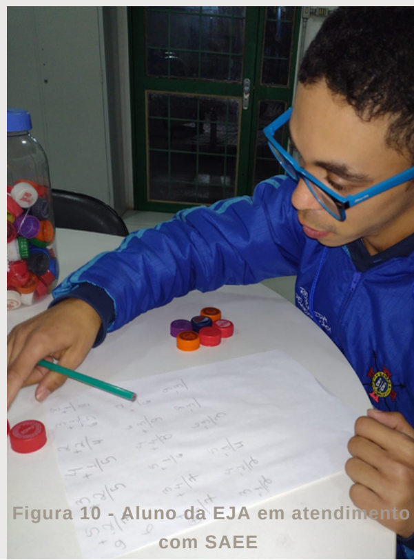
Figura 10 - Aluno da EJA em atendimento com SAEE

Será ofertado, a partir desse ano de 2023, o serviço do SAEE nas três escolas de EJA do Município de Viamão, com professor especializado, em noites alternadas, possibilitando o atendimento dos alunos com deficiência, bem como a orientação aos professores sobre o planejamento de um currículo adaptado que deverá ser ofertado a esses educandos em sala de aula.