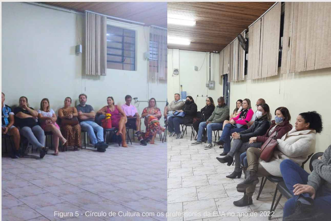
Figura 5 - Círculo de Cultura com os professores da EJA no ano de 2022