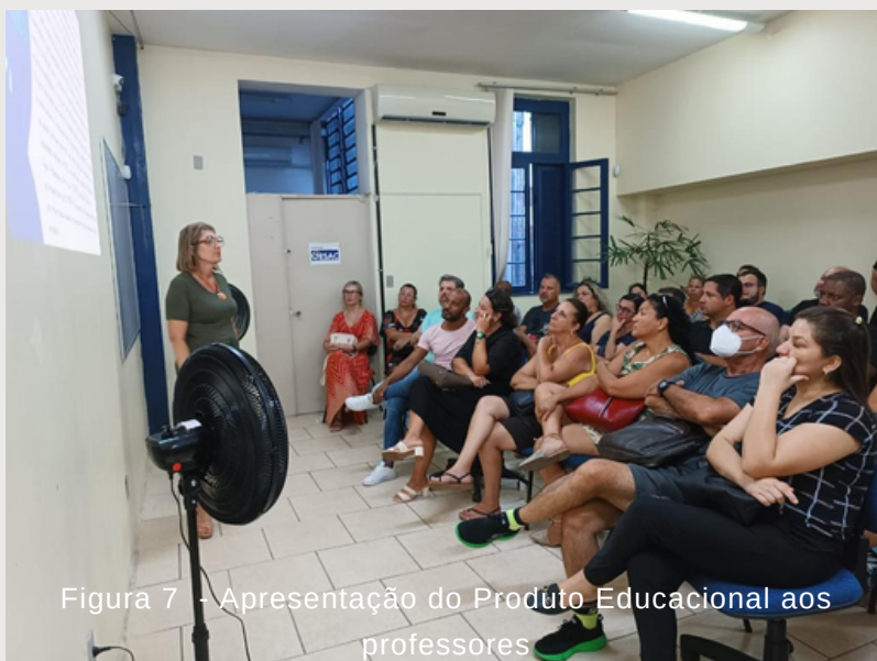
Figura 7 - Apresentação do Produto Educacional aos professores

A rede Municipal de Ensino de Viamão planeja suas ações basicamente nas metas do Plano Nacional de Educação, buscando sempre a qualidade do ensino, a permanência e êxito do aluno na escola e o desenvolvimento da cidadania. A escola hoje é a porta de entrada para o acolhimento de muitas famílias, pois se entende que é através da educação que muitos terão a oportunidade de refazerem suas vidas. Cabe à Secretaria de Educação planejar políticas educacionais com ações pertinentes à necessidade desses jovens e adultos que frequentam a EJA.