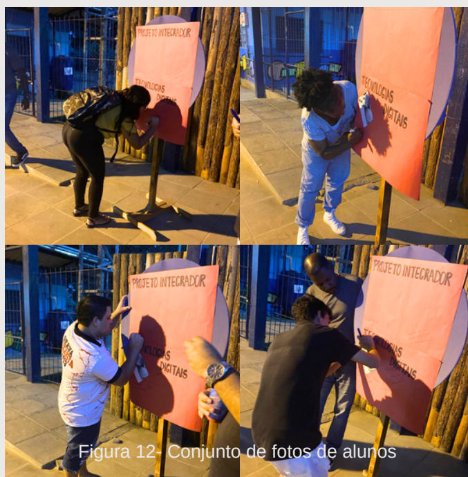
Figura 12- Conjunto de fotos de alunos

A socialização pode ser por meio de mostra de trabalhos para a comunidade interna e externa, ampliando a divulgação dos projetos trabalhados. Com a realização dessa proposta, o entendimento e a relevância dos conteúdos trabalhados devem ser aproveitados pelos educandos em suas práticas profissionais, desenvolvendo atitudes de responsabilidade e autonomia.