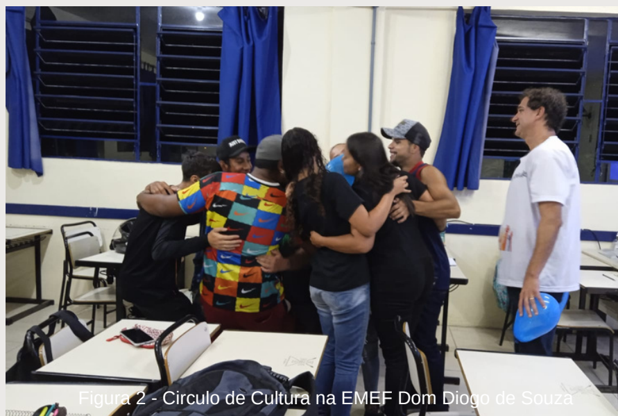
Figura 2 - Círculo de Cultura na EMEF Dom Diogo de Souza

Durante a pesquisa participante, foram realizados com os docentes e discentes, além de questionários, Círculos de Cultura para o levantamento da percepção dos sujeitos envolvidos na EJA da Rede Municipal de Viamão. Sistematizados por Paulo Freire (1991) os Círculos de Cultura estão fundamentados em uma proposta pedagógica, cujo caráter radicalmente democrático e libertador propõem uma aprendizagem integral, que rompe com a fragmentação e requer uma tomada de posição perante os problemas vivenciados em determinado contexto. Dessa forma, esses momentos foram extremamente importantes, pois instigaram o debate, evidenciando a posição dos discentes e docentes em relação a proposta da EJA em Viamão. Segue, no quadro abaixo a síntese dos dados que emergiram dos encontros do Círculo de Cultura: