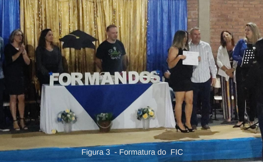
Figura 3 - Formatura do FIC

O curso FIC, apesar de ser uma proposta inovadora para a Educação de Jovens e Adultos do município de Viamão, ainda não contempla as reais necessidades dos educandos. Percebe-se isso quando se constata, ao longo do ano, a evasão dos alunos, ou seja, o curso não promoveu a permanência dos alunos na escola, conforme as expectativas da Secretaria de Educação e dos docentes e gestores das escolas envolvidas. Além disso, o Curso de Agente de Cooperativismo foi proposto sem a opção de escolha ou preferência dos educandos pela área para a qual formava e não estava articulado às demais disciplinas do currículo desenvolvido na EJA. A proposta foi extremamente individualizada, ou seja, não contemplando de forma integrada a formação do educando e não atingindo os objetivos para articulação com o mundo do trabalho.