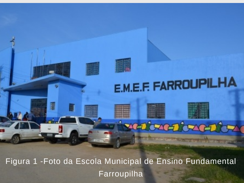
Figura 1 -Foto da Escola Municipal de Ensino Fundamental Farroupilha

A partir do ano de 2023, a Educação de Jovens e Adultos está ofertada em três escolas localizadas em diferentes áreas do município, não mais em seis como no ano de 2022. Essa proposta da Secretaria de Educação, tem a finalidade de contribuir com a implementação dessa política educacional e oportunizar maiores investimentos em ações e estratégias para a permanência e êxito desse jovem e adulto na escola.