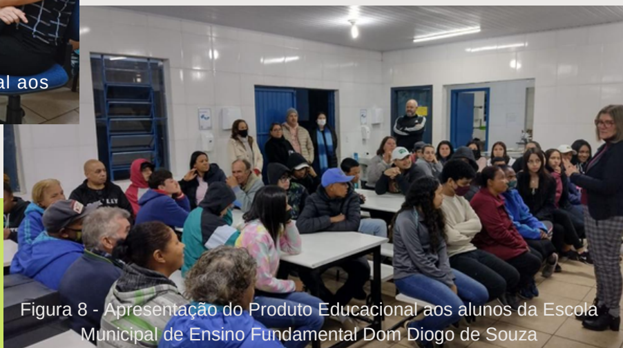
Figura 8 - Apresentação do Produto Educacional aos alunos da Escola Municipal de Ensino Fundamental Dom Diogo de Souza