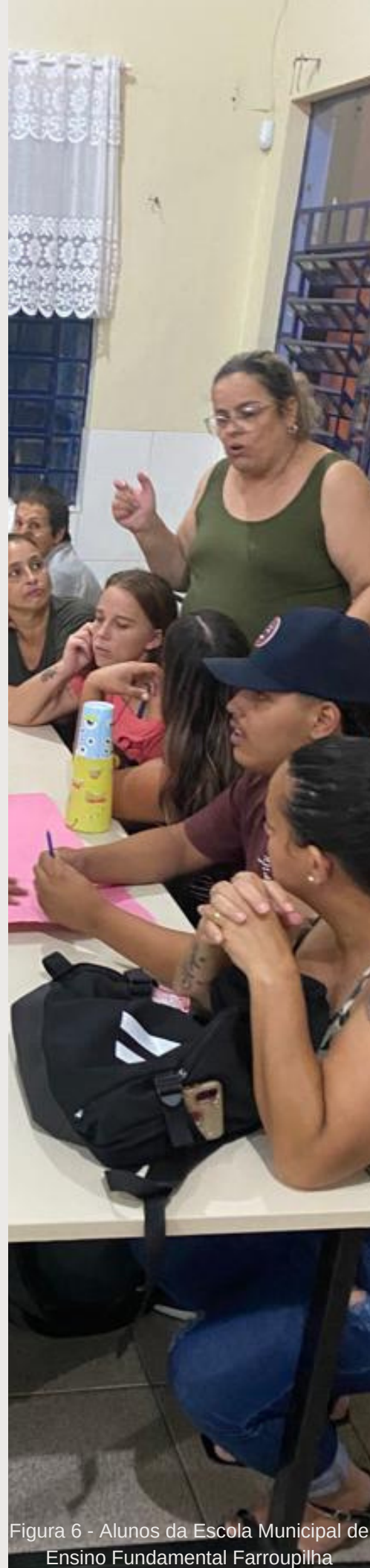
Figura 6 - Alunos da Escola Municipal de Ensino Fundamental Farroupilha

No processo de desenvolvimento do currículo, os professores precisam em conjunto buscar estratégias de ação, encontrar o equilíbrio entre a teoria e a prática, o saber e a experiência, a ação e o pensamento, transformando a prática cotidiana de um ensino além do propedêutico, mas que busque o desenvolvimento integral do educando, tendo o trabalho como princípio educativo e articulador. Para tanto, é essencial mudar o modo de pensar o currículo, promovendo discussão, avaliação e tomada de decisão coletivamente. Será necessário, também, criar espaços que favoreçam os debates, momentos de estudo para aprofundar a proposta da politécnica e a organização do planejamento entre os professores.