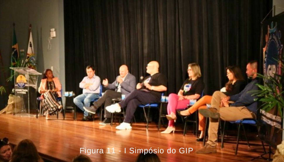
Figura 11 - I Simpósio do GIP