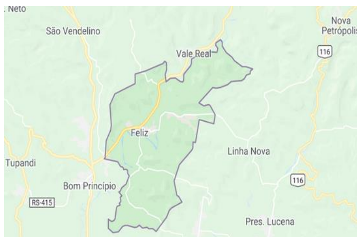
Figura 1: mapa de Feliz-RS

Disponível em: < https://www.cidade-brasil.com.br/mapa-feliz.html >. Acesso em Out, 22. 2019.