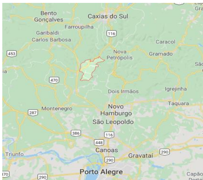
Figura 2: mapa da região

Disponível em: < https://www.cidade-brasil.com.br/mapa-feliz.html >. Acesso em Out, 22. 2019.