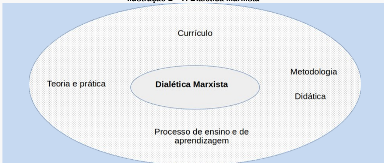
Ilustração 2 – A Dialética Marxista

De igual modo, a dialética marxista necessita incorporar-se ao processo de ensino e de aprendizagem, bem como ao currículo do EMIEP, conforme se demonstra, na ilustração 2, abaixo: