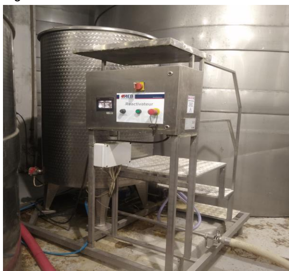
Figura 10 - Reidratador de leveduras.

Na autoclave, após 24 horas da junção do pé de cuba ao mosto é feita a correção nutricional e chaptalizaçõa. Na vinícola é utilizados dois nutrientes: Fermoplus Integrateur (AEB) um fosfato de amônio bibásico, formado de parede celular de leveduras e o Fermoplus Millennium (AEB) um nutriente de sais amoniacaais, tiamina, preparado de parede de leveduras e celulose. A capitalização é realizada visando aumentar o teor alcoólico, leva-se em conta que para 1°GL a levedura precisa de aproximadamente 17g de açúcar por litro de mosto.