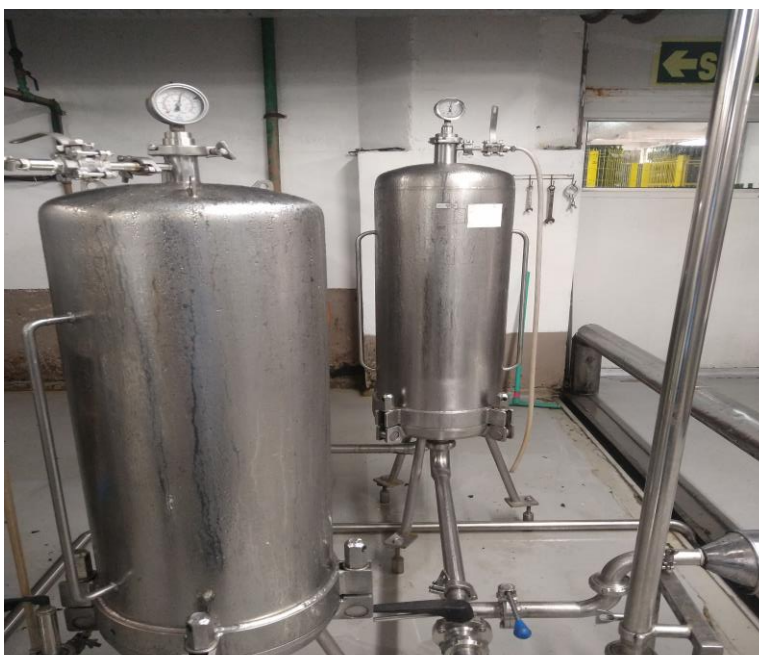
Figura 12 - Módulos Filtrantes.