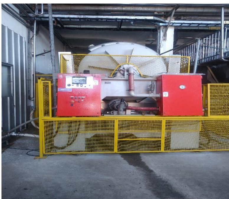
Figura 7 – Prensa Diemme utilizada para a prensagem das uvas.

Após o término dos ciclos, está concluído a prensagem, as portas se abrem e a prensa começa a girar expulsando o bagaço e a semente que restou no interior dela.