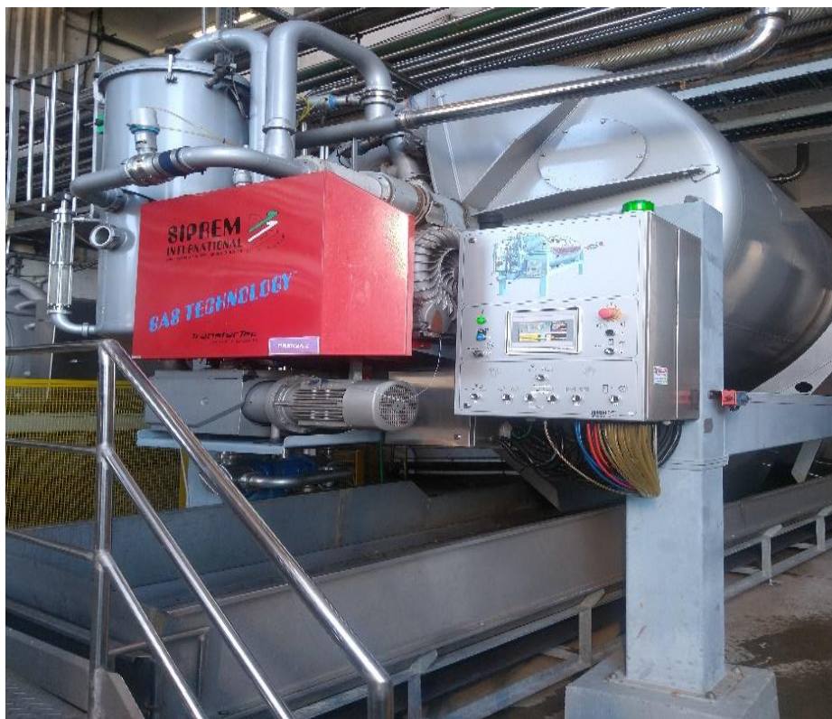
Figura 8 – Prensa Siprem.