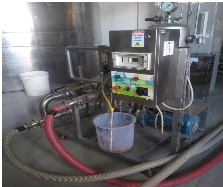
Figura 9 – Equipamento utilizado para realização da flotação.