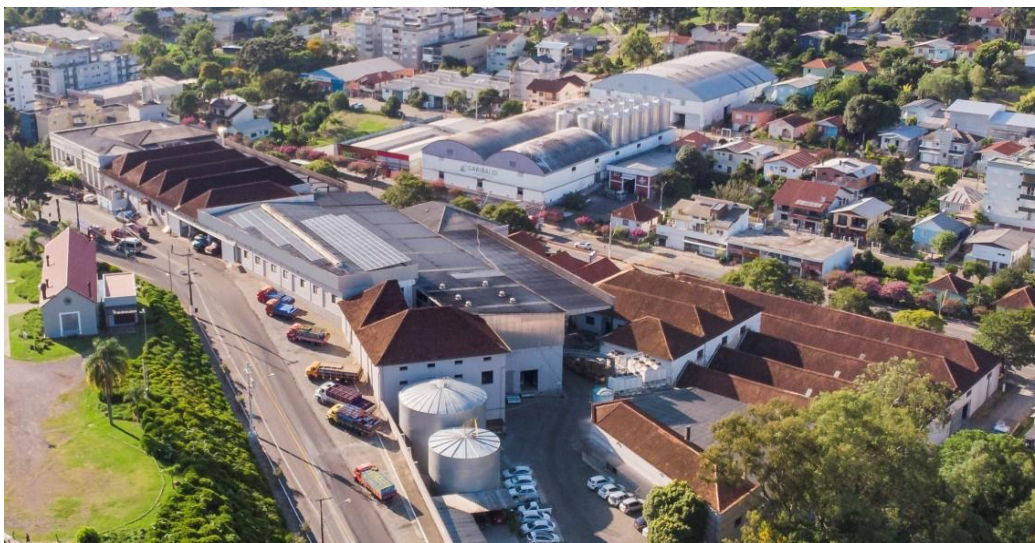
FIGURA 1 – Vista aérea da localização da Cooperativa Vinícola Garibaldi LTDA.