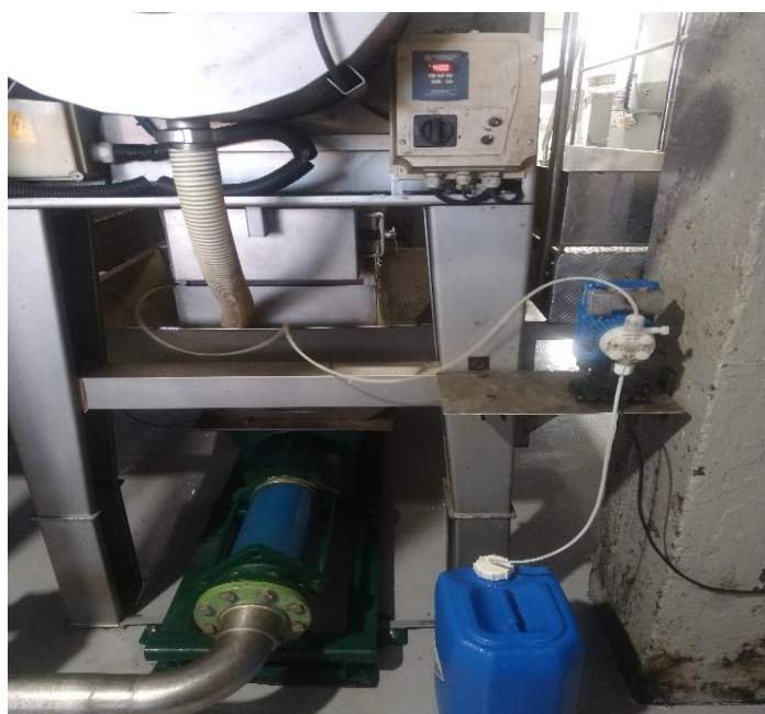
Figura 6 - Sistema de bombeamento de SO 2 .

No momento do desengace, através de bombas dosadora (Figura 6), é feita a adição do dióxido de enxofre, neste momento em que a uva é desengaçada entendesse que é ponto mais crucial para possíveis contaminações como leveduras selvagens, bactérias e outros micro-organismo e de enzimas que a escurecem o mosto. A dose utilizada depende da avaliação da sanidade da uva, podendo várias 20 mg/L para uvas de boa sanidade até 30mg/l para uvas de não tão boa sanidade.