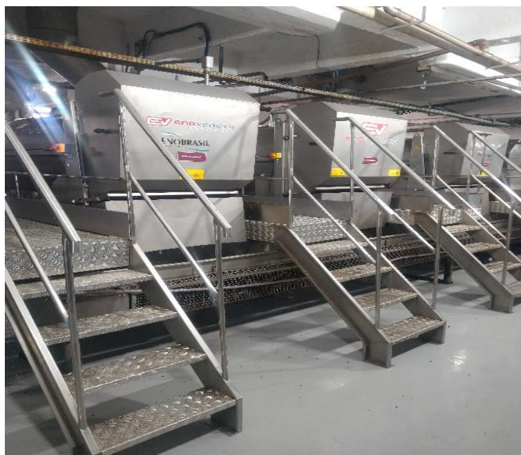
Figura 4 – Desengaçadeiras Enoveneta.

Na Cooperativa Garibaldi, a quatro desengaçadeira da marca Enoveneta horizontal (Figura 4), de modo que durante o pico da safra três trabalham a pleno, sendo que duas para uvas brancas e uma para uvas tintas e uma desengaçadeira funciona como becape. Neste momento a uva entra na parte superior da desengaçadeira, logo caindo no tambor principal, cujo a força centrífuga realiza a separação das bagas do ráquis, após a separação as bagas se encaminham para a saída da desengaçadeira onde passam por um último estágio que é dois rolos que giram em sentido opostos com a função de fazer o rompimento das bagas sem danificar as sementes.