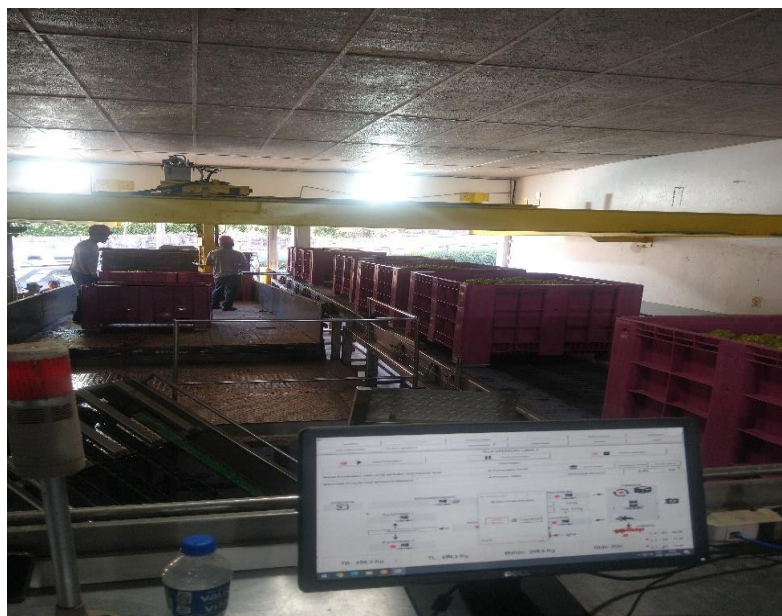
Figura 3 – Bins para o de transporte de uva.

O recebimento conta com três esteiras de descarregamento, sendo uma específica para uvas tintas e as outras duas para uva brancas, toda a uva recebia na Garibaldi são através de Bins (Figura 3), que venho para substituir as caixas plásticas de 20kg, com a capacidade de carga de 400kg ele apresenta inúmeras vantagens com relação as caixas: Proteção contra esmagamento da uva, facilita no transporte e descarregamento, melhor ventilação da uva, otimização do espaço, redução da mão de obra, conforme mostra a figura abaixo.