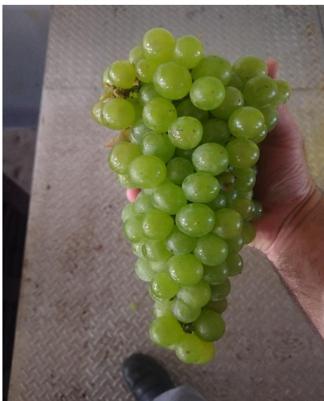
Figura 2 - Cacho de uva Moscato Branco.

A uva Moscato (Figura 2) é uva variedade Vitis vinífera , Segundo Cosmo e Caló (1960, apud LAMAS JUNIOR, 2008) a variedade Moscato tem sua origem possivelmente da Grécia, sendo ainda muito cultivada na região da Itália, na província de Trento. Com o passar do tempo se estabilizou no Brasil, hoje em dia é referência em elaboração de espumante, sendo a mais procurada por consumidores, seus vinhos e espumantes são muito ricos aromaticamente, frescos e leves, sendo amplamente utilizada em sua maioria na elaboração de espumantes moscateis, pelo método Asti (Zanus, 2021). Na Cooperativa Garibaldi, este produto é o carro chefe na categoria espumante, acumula várias premiações nacional e internacional devido sua qualidade elevada.