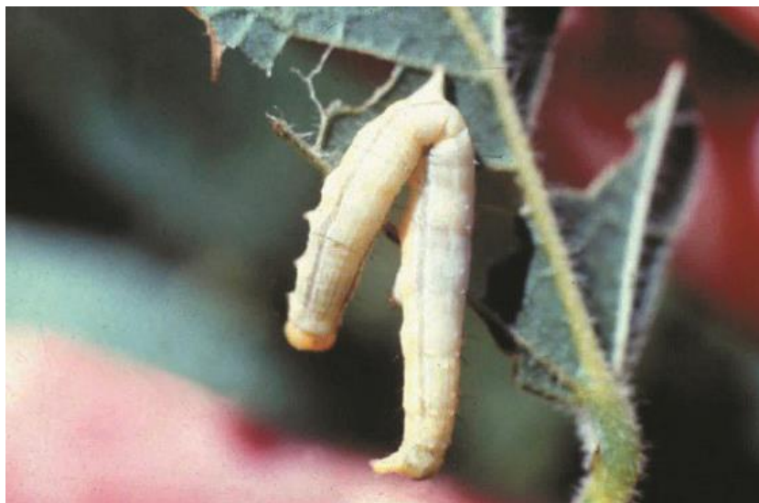
Figura 5 - Lagarta-do-Cartucho morta por intoxicação do Bt

A principal aplicação do Bt na agricultura é o controle biológico de pragas, sendo uma alternativa sustentável ao uso de inseticidas químicos. As toxinas produzidas pela bactéria são ativadas no intestino alcalino dos insetos, formando poros nas células intestinais e levando à morte do organismo (Figura 5). Esse mecanismo de ação seletiva permite que o Bt cause pouco ou nenhum dano a insetos benéficos, mamíferos, aves e humanos (Gilliam et al. , 2012).