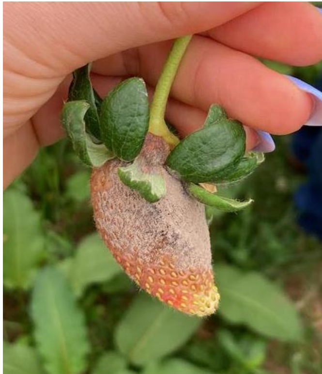
Figura 16 - Botrytis cinerea

Além do Ácaro, durante o período do estágio também ficou evidente o impasse da doença fúngica Botrytis cinerea , (Figura 16) e (Figura 17).