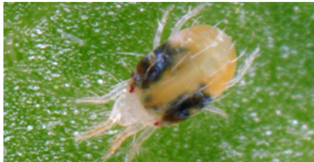
Figura 14 - Ácaro-Rajado

O controle do ácaro-rajado deve ser integrado, envolvendo o monitoramento frequente da lavoura, o uso de produtos seletivos, a introdução de inimigos naturais, como Phytoseiulus persimilis , e a rotação de acaricidas com diferentes modos de ação. A utilização de manejo integrado de pragas (MIP) é fundamental para evitar surtos e reduzir o risco de resistência (Santos et al. , 2020).