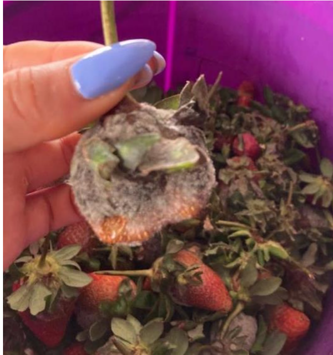
Figura 17 - Botrytis cinerea