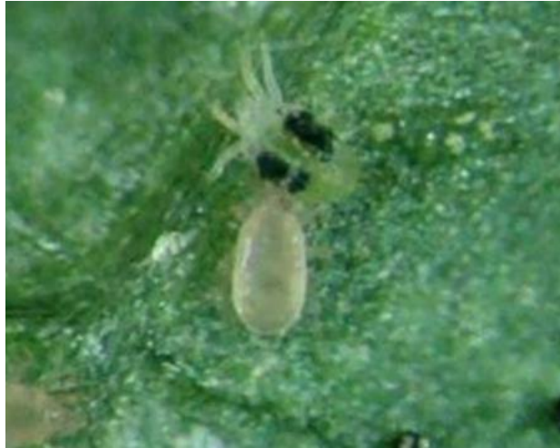
Figura 15 - Acaro predador

impacto sobre organismos benéficos e pode ser uma alternativa viável no manejo integrado da praga.