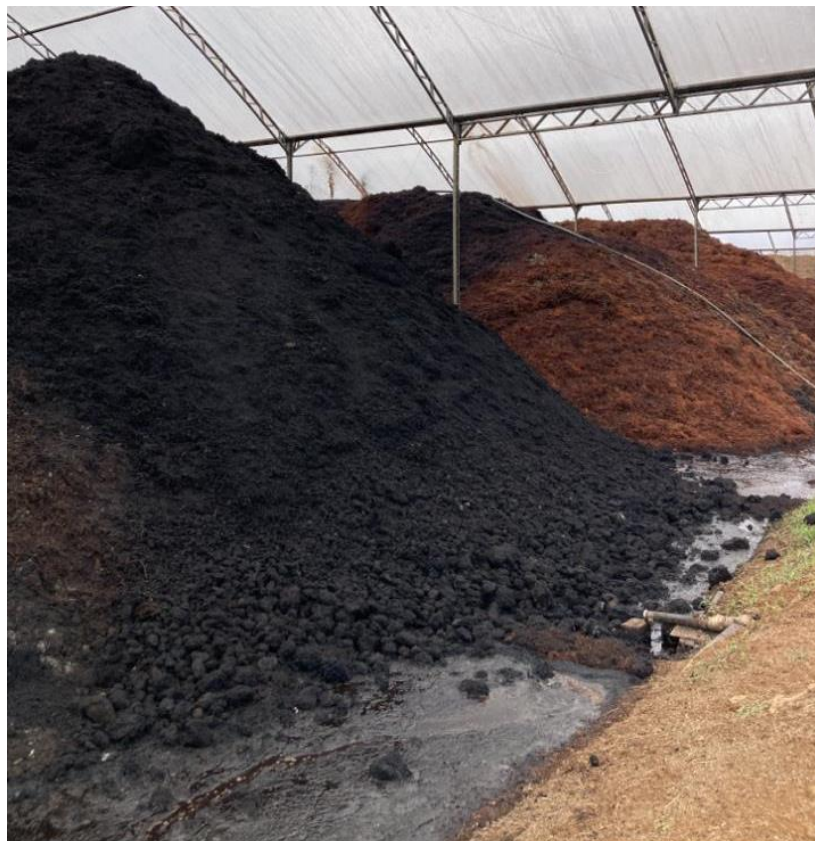
Figura 12 – Compostagem realizada pela empresa Beifiur

A Beifiur é reconhecida por sua atuação na transformação de resíduos orgânicos, especialmente bagaço, engaço e sementes de uva, em compostos orgânicos sólidos e líquidos. Esses compostos são utilizados na produção de adubos, substratos e outros produtos de alta qualidade. A empresa realiza a compostagem desses materiais (Figura 12), promovendo a vida do solo e contribuindo para práticas agrícolas mais sustentáveis (Beifort, 2023).