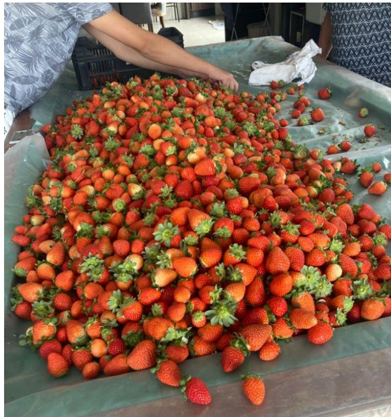
Figura 13 - Morangos orgânicos na propriedade de Marcelo, Caxias do Sul-RS

A maioria das visitas foi realizada em propriedades produtoras de morango ( Fragaria x ananassa ), (Figura 13) e de forma unânime, todos os agricultores relataram incidência significativa de ácaros durante a safra, com destaque para o ácaro-rajado ( Tetranychus urticae ), praga que tem causado prejuízos consideráveis à cultura.