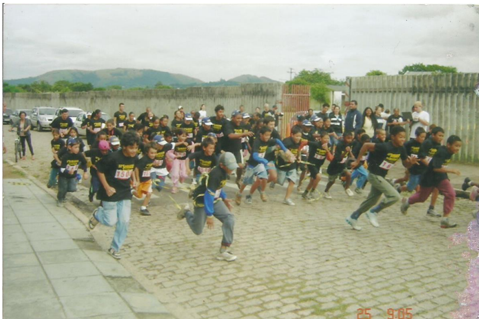
Figura 2. Largada da rústica da Restinga no Complexo Esportivo Barro Vermelho na 33ª Semana da Restinga.