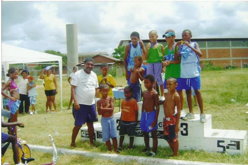
Figura 5. Podium da I Rústica de Verão na Restinga.

comunidade começa a se modificar a partir da corrida e se torna um outro lugar que antes era desconhecido. Ocorre uma ocupação de espaços antes inabitáveis pelos conflitos que foram gerados no passado.