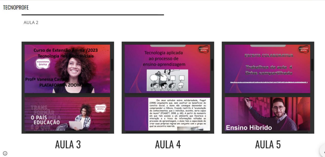
Figura 6 – Material do curso Tecno PROFE