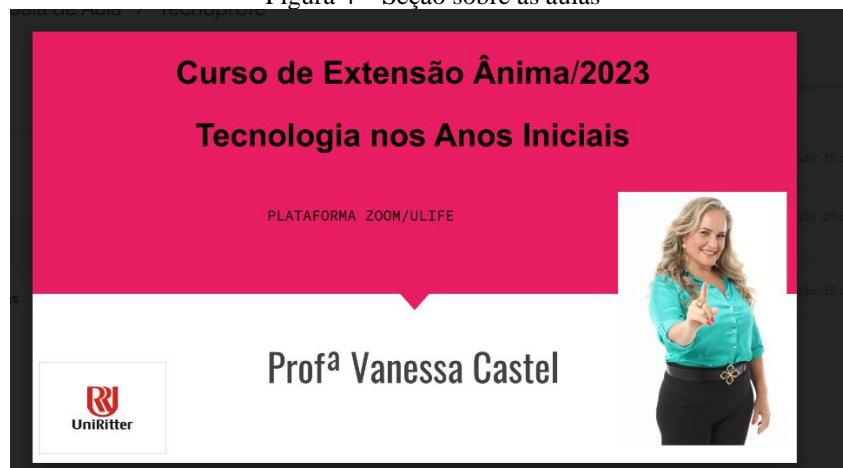
Figura 4 – Seção sobre as aulas

Além disso, o Tecnopefe destaca a importância da inclusão digital em uma sociedade cada vez mais informatizada. O curso promove uma compreensão crítica acerca da função das TICs na redução das desigualdades educacionais e sociais. As alunas serão encorajadas a refletirem sobre como garantir que todos os estudantes tenham acesso igualitário aos recursos digitais, contribuindo para uma educação mais inclusiva e democrática e diretamente aplicada ao uso no mundo do trabalho, nas suas práticas docentes – sendo protagonistas da sua própria formação.