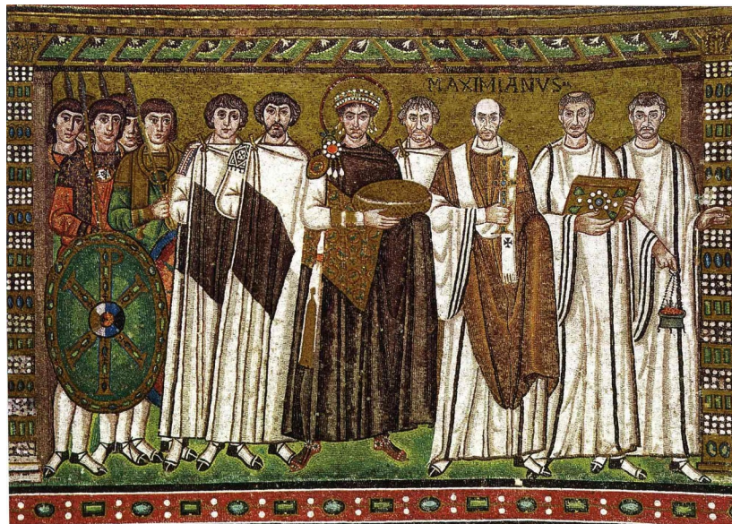
Figura 3- Imperador Justiniano e sua corte

Fonte: Enciclopædia Britannica, 2022. Acesso em: https://www.britannica.com/biography/Justinian-I