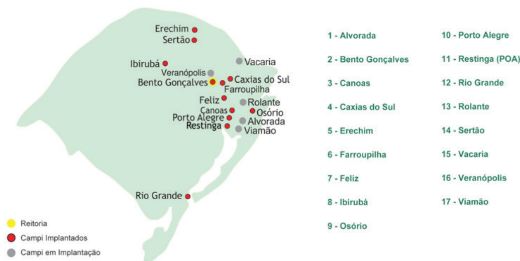
Figura 2 - Unidades do IFRS

quanto as que foram incorporadas já sob o signo de Instituto Federal. A partir de então, iniciaram-se os trâmites para a criação do Programa Institucional Núcleo de Memória do IFRS.