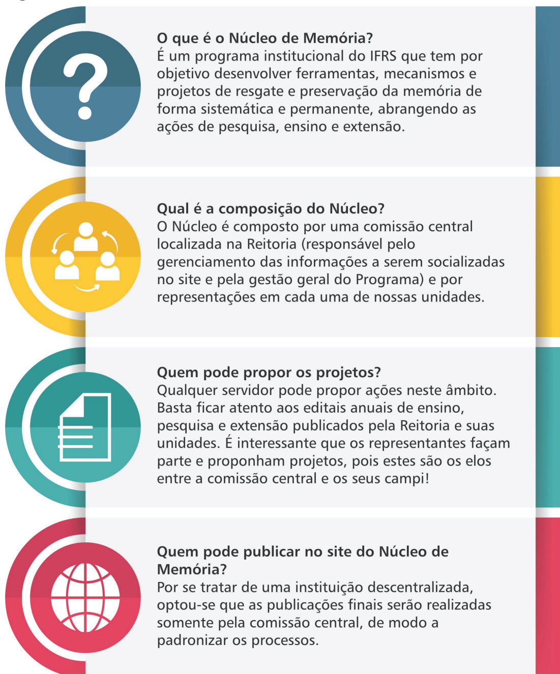
Figura 3 - Núcleo de Memória do IFRS

Mas... o que mesmo faz o NuMem? Como eu posso participar?