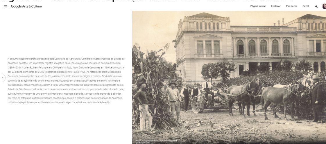
Figura 10 - Modelo de exposição virtual CMU "Avante São Paulo".