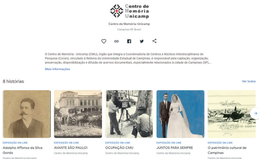
Figura 9 - Exposições online CMU-Google Arts&Culture