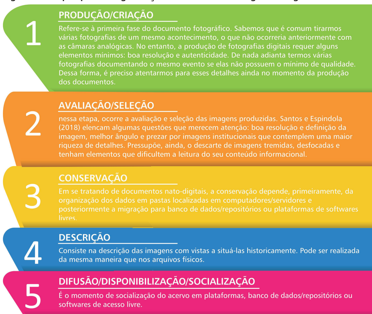
Figura 6 - Etapas para a organização de um acervo fotográfico digital