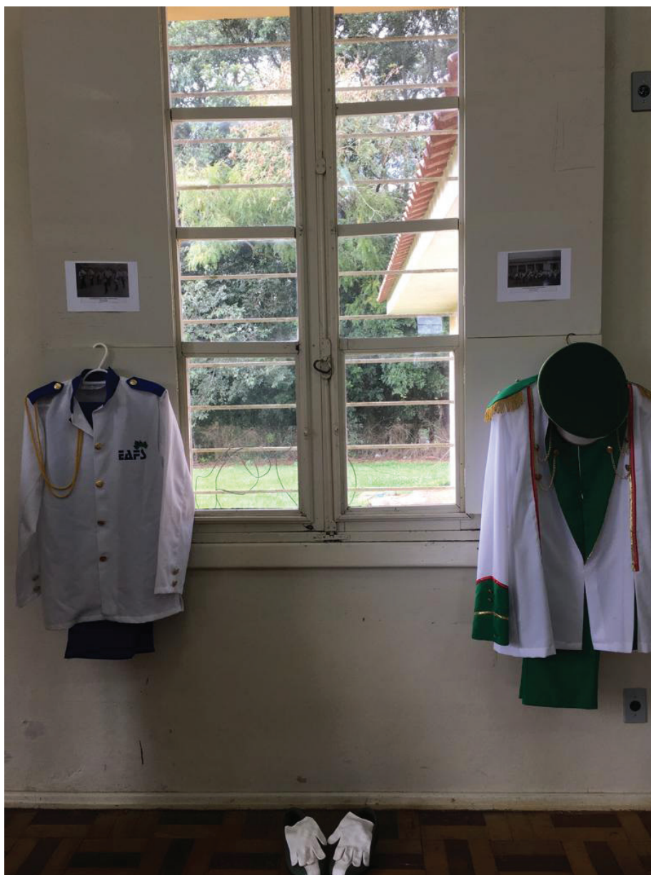
Figura 4 - Uniformes da banda marcial