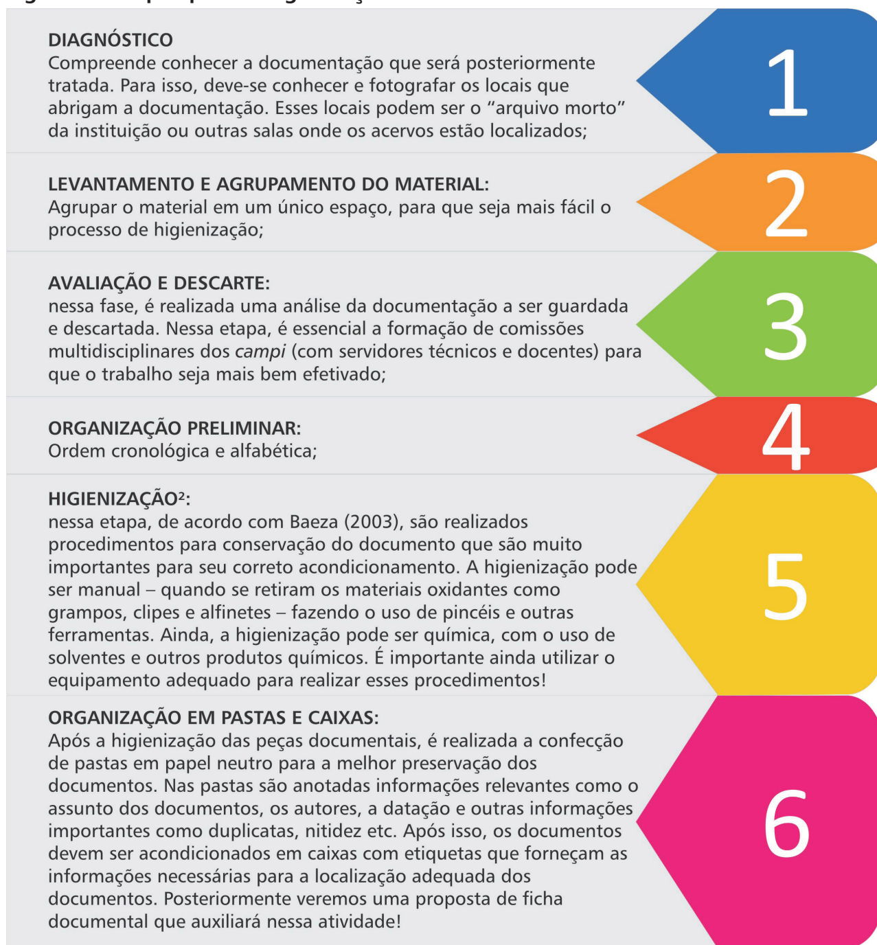
Figura 7 - Etapas para a organização de acervos documentais