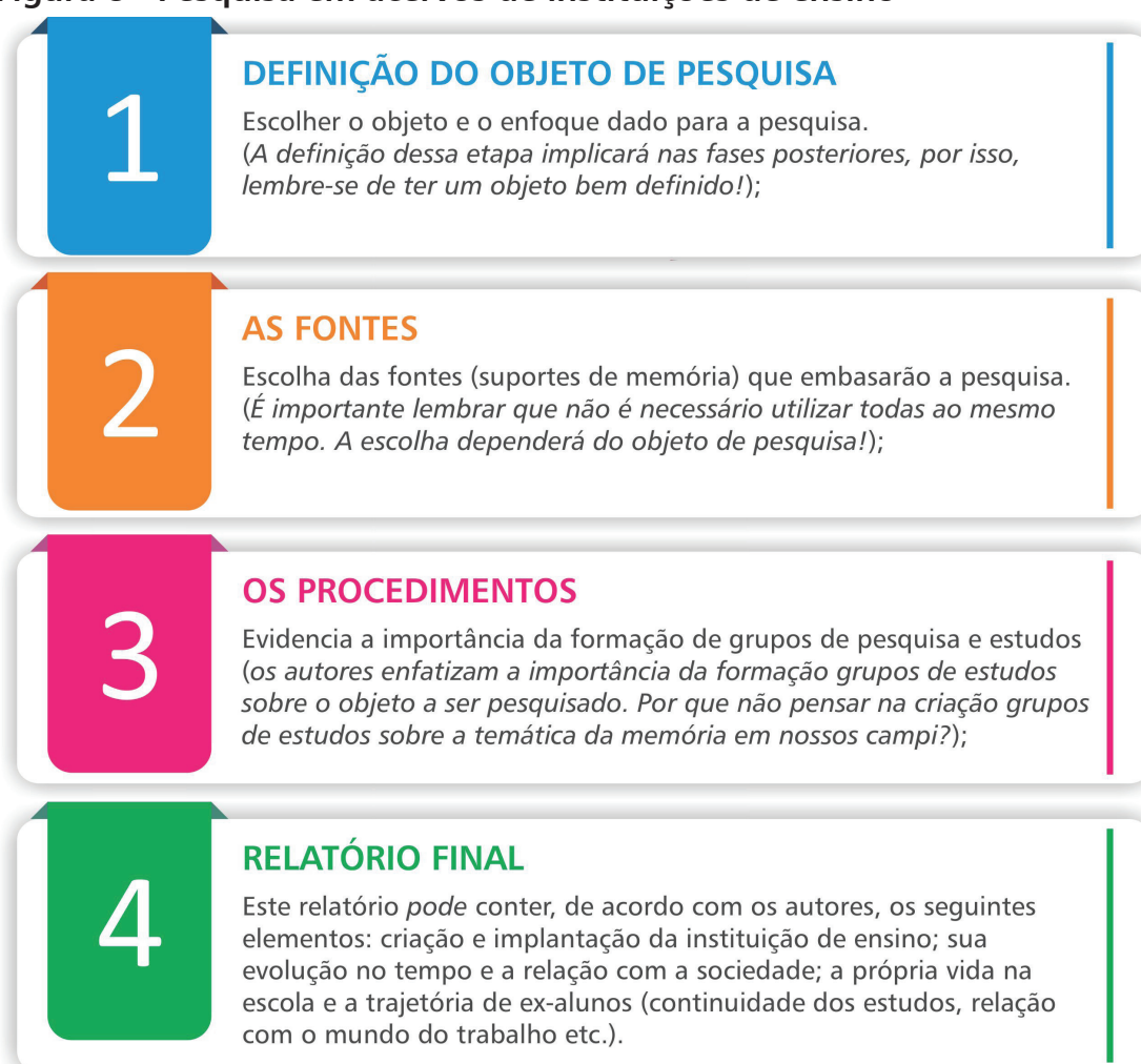
Figura 8 - Pesquisa em acervos de instituições de ensino