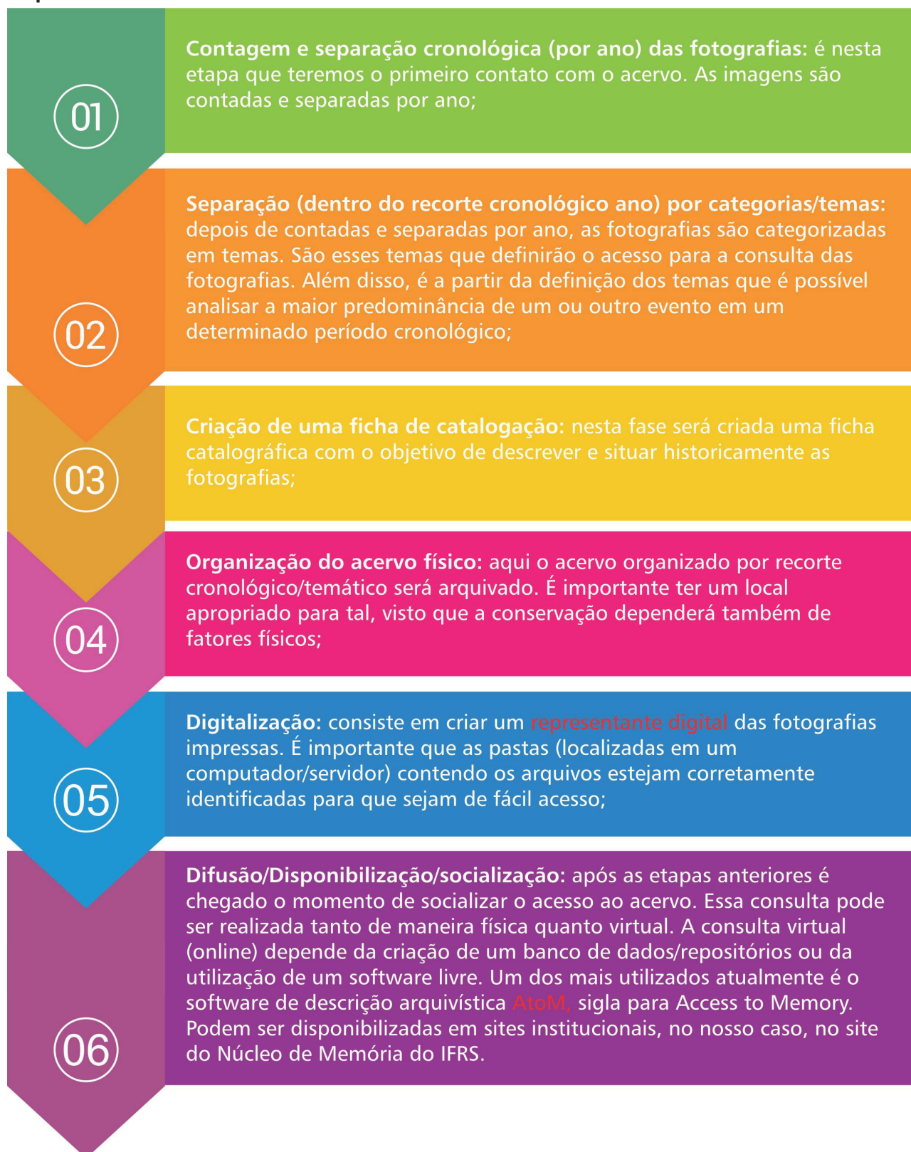
Figura 5 - Etapas para a organização de um acervo fotográfico de imagens impressas

Fonte: adaptado de Rosa, Branchini e Nunes (2012).