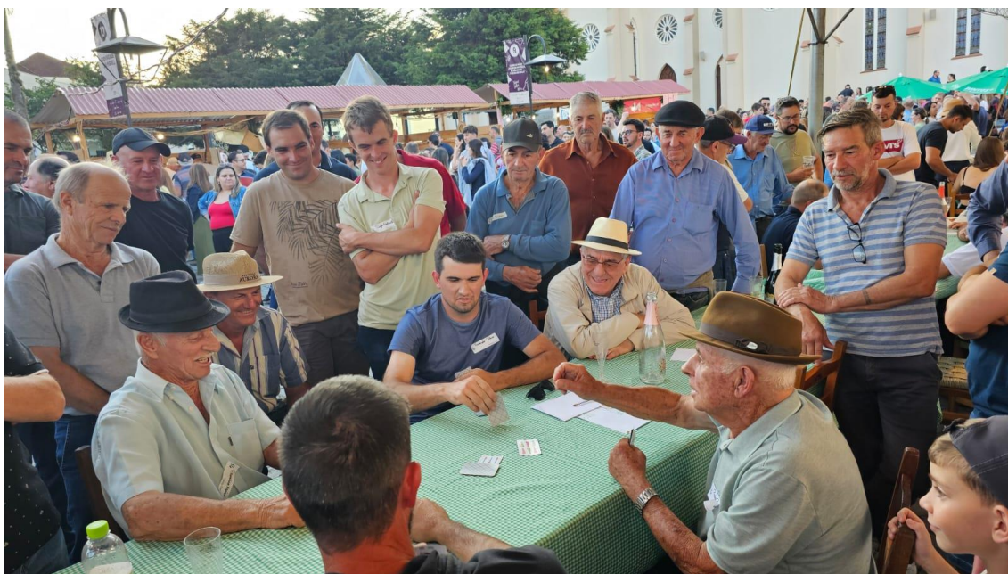
Figura 4 - Campeonato de Bisca realizado no Festival do Grostoli