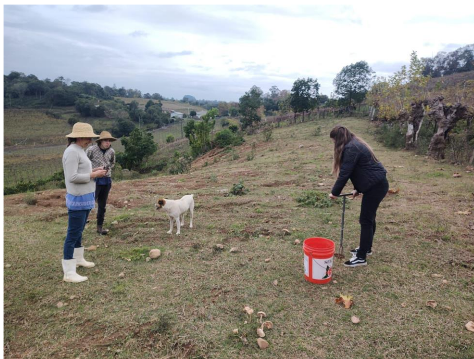
Figura 2 - Coleta de solo com trado amostrador em uma propriedade