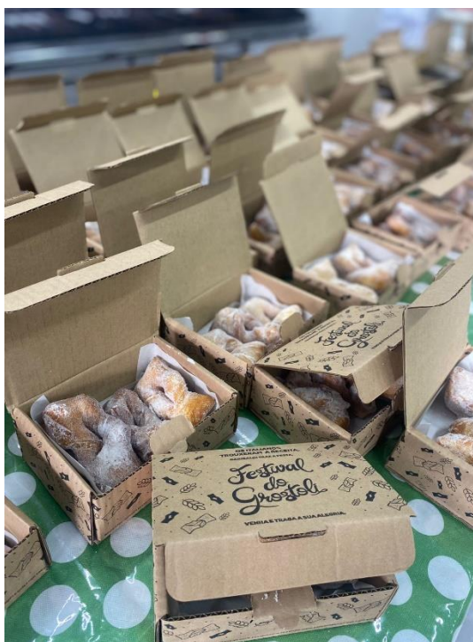
Figura 5 - Material para o marketing do Festival do Grostoli

O envolvimento da comunidade foi um dos pontos mais marcantes do festival. O engajamento de famílias, escolas, entidades religiosas e clubes de mães reforçou o aspecto coletivo da iniciativa. Durante o desenvolvimento do evento, foram utilizados materiais promocionais e ações de marketing que buscaram destacar o grostoli como símbolo da herança cultural local. Foi realizado material juntamente com a comunidade para realização do marketing antes do festival, conforme a figura 1.