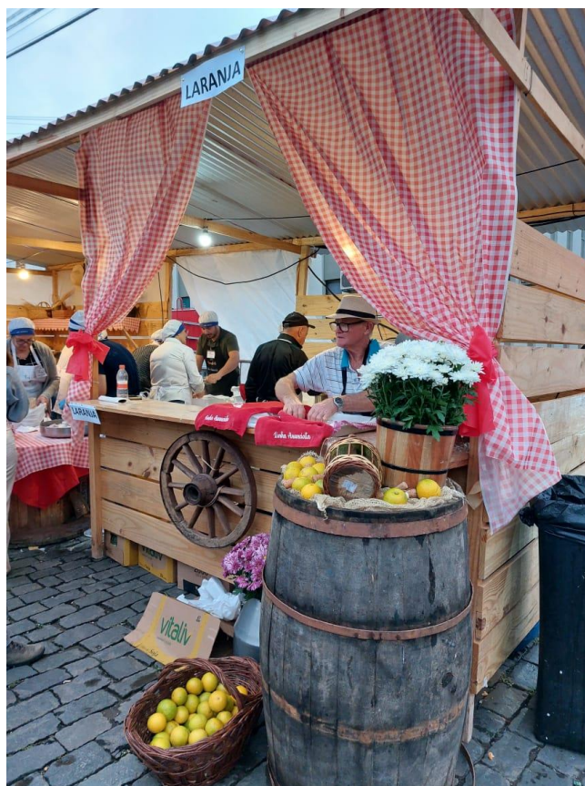
Figura 3 - Barracas da comunidade de Anunciata onde vendiam os gostolis