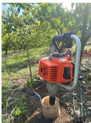
Figura 5. Coleta de solo para análise

Além das análises de solo, houve uma crescente demanda pela coleta de tecido foliar, especialmente em frutíferas perenes, como videiras e pessegueiros, que permanecem implantadas no campo durante todo o ano. As análises foliares complementam as de solo, permitindo que o produtor entenda não apenas o que está disponível no solo, mas também quais nutrientes estão efetivamente sendo absorvidos pelas plantas. Essa integração das informações facilita o planejamento da adubação, garantindo que as quantidades aplicadas correspondam à demanda nutricional real das culturas, evitando excessos e desperdícios.