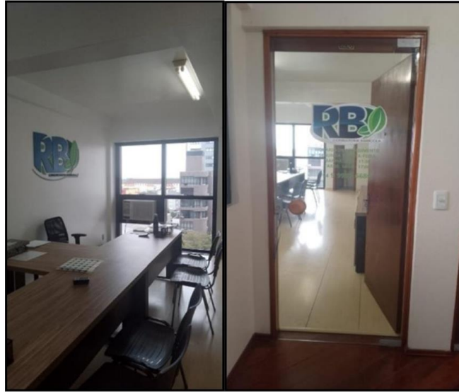
Figura 1. RB Consultoria Agrícola LTDA, matriz Farroupilha