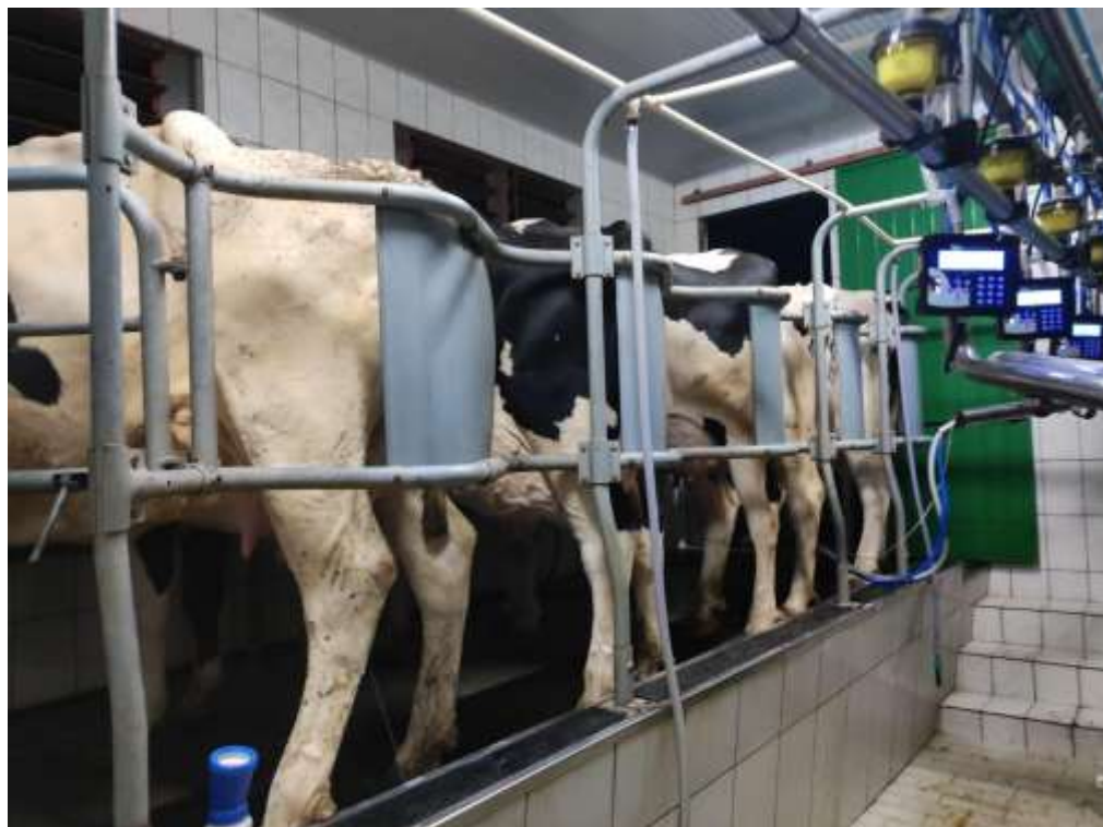
Figura 2 - Sala de ordenha.