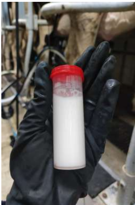
Figura 3 - Frasco para coleta de amostra de leite individual.