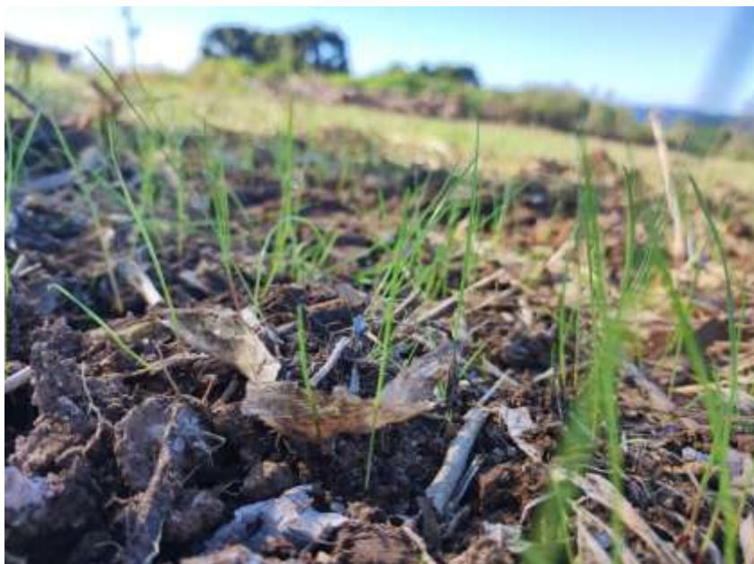
Figura 14 - Azevém recém-nascido.