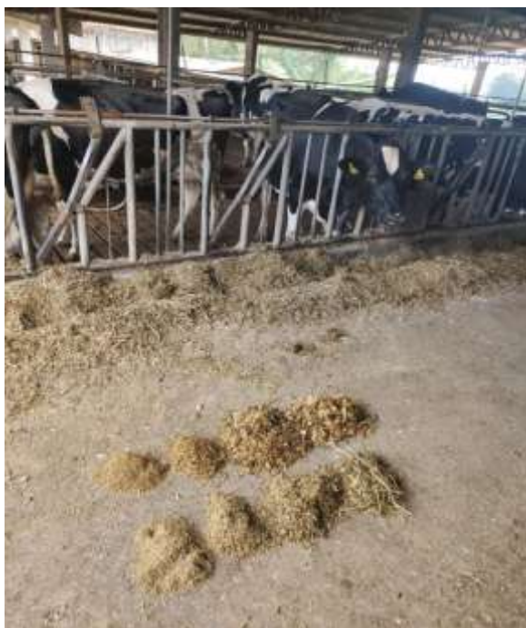
Figura 10 - Teste da peneira.

Mensalmente a dieta é formulada com a ajuda de um nutricionista que visita a propriedade visando melhorar parâmetros da dieta e/ou adaptar com os ingredientes disponíveis dentro daquele período, aumentando a produtividade das vacas. Além dele explicar como era o funcionamento da dieta, foi realizado o teste da peneira com a silagem de milho retirada do silo e com a ração completa (Figura 10).