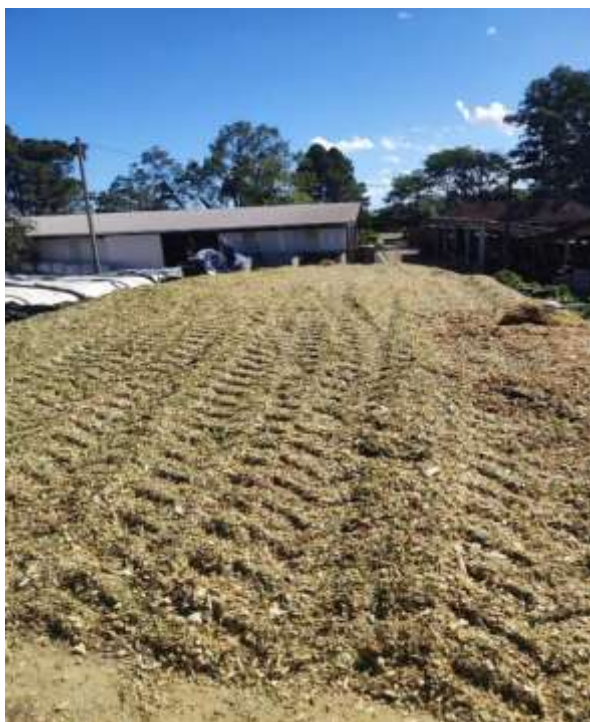
Figura 12 - Silo de silagem de milho.

De forma geral, a silagem é o produto resultante do processo de anaerobiose, com acidificação do material verde e que permite o armazenamento por longos períodos, conservando seu valor nutritivo o mais próximo do material original e com perdas mínimas. Para uma silagem de boa qualidade vários fatores interferem como: acúmulo de matéria seca na planta, quantidade de carboidratos solúveis, poder tampão, população microbiana favorável, tamanho das partículas do material colhido, vedação adequada, velocidade do enchimento do silo, compactação, tipo de silo e drenagem eficiente dos efluentes (D'OLIVEIRA; OLIVEIRA, 2014).