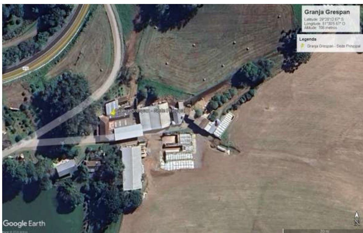
Figura 1 - Sede da Granja Grespan.