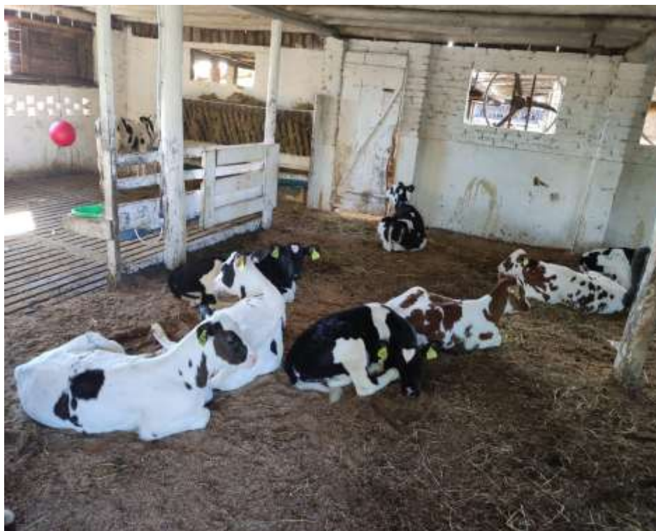
Figura 8 - Bezerras no sistema coletivo.

Após 10 dias em média, o bezerro já não recebia mais o leite proveniente da ordenha, sendo transferido até o bezerreiro, onde já se encontrava várias terneiras (Figura 8). Durante o estágio, a quantidade de animais máxima que tivemos neste local foi 13 animais, sendo 12 bezerras e um macho, sendo estes eventualmente criados para engorda. Todos os animais, seja macho ou fêmea recebem o mesmo tratamento e carinho, bem-estar é prioridade.