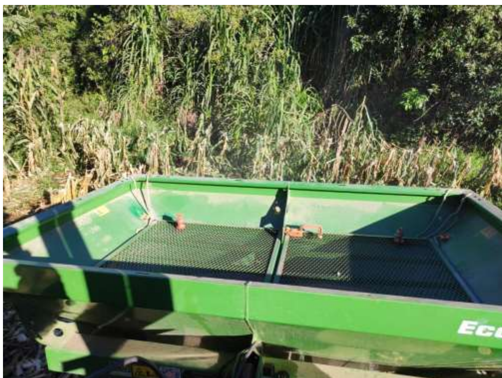
Figura 13 - Semeadura do azevém e trevo com o funil acoplado no trator.

as bactérias. Para 1 hectare foi utilizado 18 kg de semente de azevém e 5 kg de semente de trevo. Assim, com a mistura pronta, foi colocado tudo no funil acoplado ao trator e semeado nas áreas. No trator havia um GPS que mostrava as áreas semeadas e o local que já ocorreu essa semeadura, evitando assim, que caíssem sementes em excesso no mesmo lugar (Figura 13).