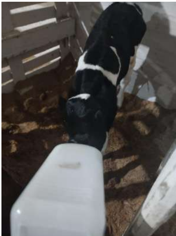
Figura 7 - Administração de colostro com a mamadeira.

O colostro pode ser fornecido com o auxílio da mamadeira ou em casos que o animal não se alimenta, utilizar sonda esofágica, de modo a garantir o consumo do volume adequado. Desta forma, o colostro era fornecido com a mamadeira e a ingestão era variável, entre 2 litros ou mais dependendo do animal (Figura 7). A mamadeira era ofertada duas vezes ao dia, primeiramente com o colostro e após isso com o leite de transição. A maioria tomava mais que uma mamadeira, porém houve um caso, onde o bezerro nasceu de noite e não foi tirado da mãe logo e acredita-se que ele amamentou na mãe, pois não aceitou a mamadeira e a vaca produziu pouco colostro. Neste caso ocorreu a passagem da sonda esofágica e o consumo de leite foi de 4 litros. São casos muito raros que ocorre e a propriedade prioriza que os recém-nascidos mamem na mamadeira, pois a sonda acaba sendo invasiva e se colocada de forma incorreta, pode acarretar na morte no terneiro (a), se a sonda inserida no canal errado, ou seja, introduzida nas vias respiratórias.