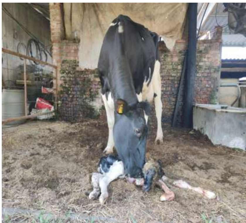
Figura 5 - Vaca limpando a bezerra recém-nascida.

Na propriedade, quando o bezerro (a) nascia ficava em contato com a mãe em torno de meia hora até que ela pudesse limpá-lo, iniciando ali o estímulo para a produção (Figura 5).