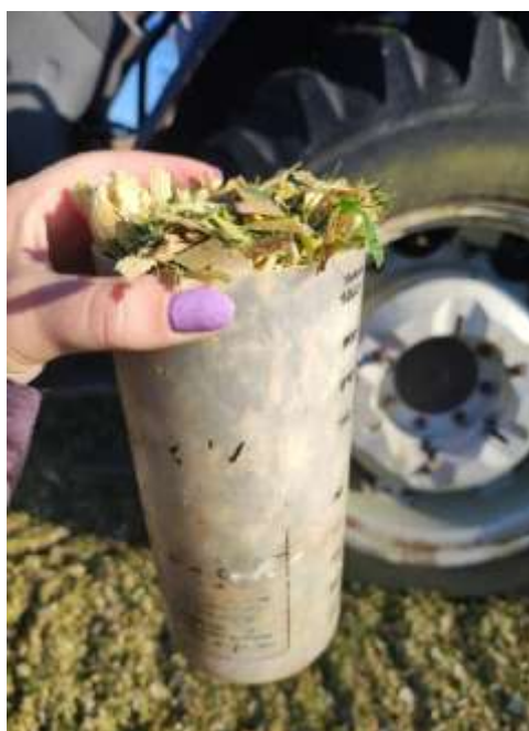
Figura 11 - Teste do copo de um litro de silagem.

A colheita da silagem ocorreu no dia 05 de abril de 2025 com uma máquina autopropelida da propriedade da Granja Cichelero que é vizinha e faz trabalhos terceirizados na época de safra. Neste ano, devido ao solo estar muito úmido, não foi possível entrar nas terras com o caminhão, sendo então toda a silagem carregada em carroções dos tratores. Neste dia, foi feita a determinação da umidade com o auxílio de uma air fryer , sendo que a estimativa foi de 44,55%. E também foi feito o teste do copo de um litro para saber a quantidade de possíveis grãos inteiros que poderiam ter, não sendo encontrado nenhum, o que indica que a máquina estava com as facas afiadas e bem reguladas (Figura 11).