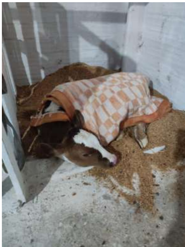
Figura 6 - Bezerra recém-nascida, com serragem e cobertor para se aquecer no frio.