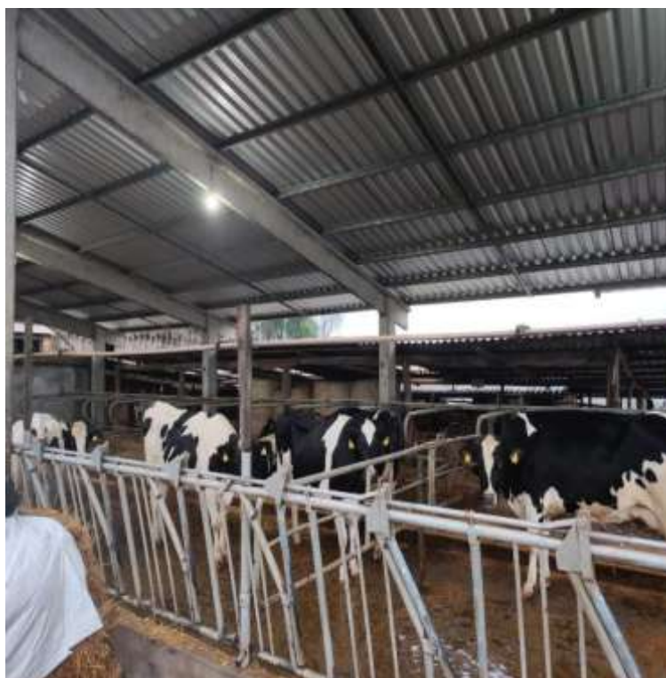
Figura 4 - Galpão de vacas em pré-parto e vacas secas.

Na Granja, as vacas, quando faltam 21 dias para parir, são transferidas de local, porém no mesmo galpão das vacas secas, mas separadas entre si (Figura 4). Neste local, elas ficam até o momento que estão prontas para parir, ou seja, quando a bolsa estourou ou quando os pés do bezerro (a) já estão aparecendo. Este manejo é o mesmo do recomendado pela literatura, a qual recomenda que entre 20 a 30 dias antes do parto, a vaca deve ser levada para a maternidade, ou seja, mais próximo da visão do produtor para acaso no dia do parto ter que auxiliar e assim monitorar o animal também (RIBEIRO, 2021).