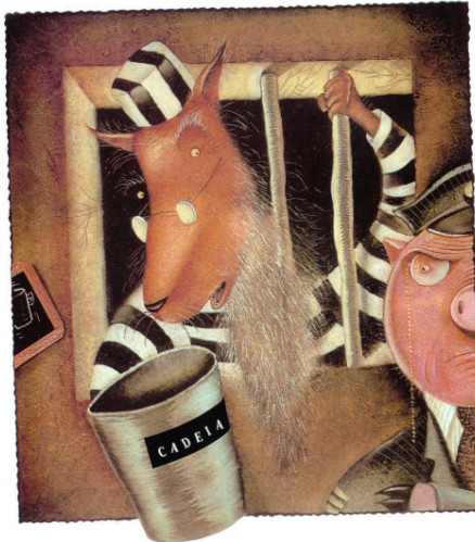
Figura 3 - Página 32 do livro “A Verdadeira História dos Três Porquinhos”

Mas talvez você possa me emprestar uma xícara de açúcar.