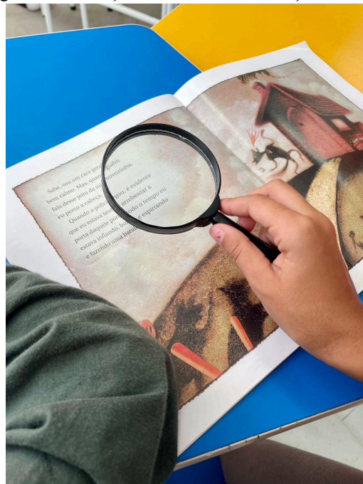
Figura 5 - Crianças analisando as ilustrações do livro