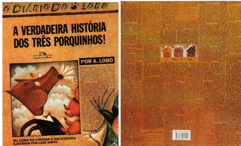
Figura 1 - Capa e contracapa do livro “A Verdadeira História dos Três Porquinhos”

dos três porquinhos, A de palha, B de madeira e C de tijolo, escrito embaixo “os cenários dos crimes”.