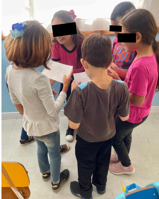
Figura 6 - Grupos reunidos para definir as regras do tribunal