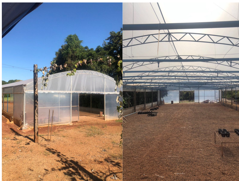
Figura 6 - Estufa onde foi acondicionado o experimento de estaquia de Eugenia pyriformis .