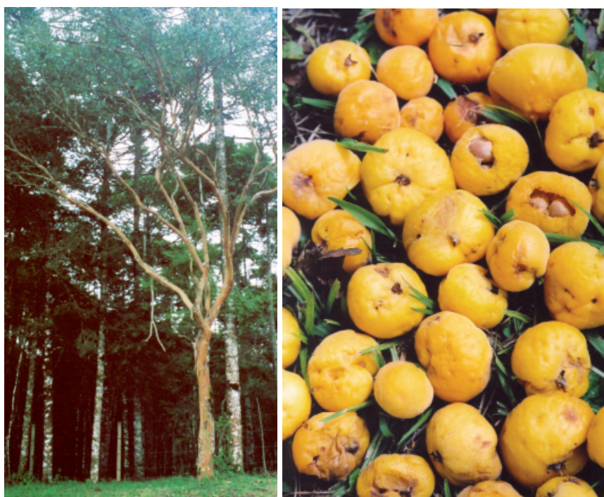
Figura 1 – Árvore (A) e Frutos da uvaia (B) ( Eugenia pyriformis ).

Eugenia pyriformis C. é uma espécie arbórea nativa (Figura 1 A), de comportamento perenifólio. As maiores árvores atingem dimensões próximas a 15 m de altura e 40 cm de DAP (diâmetro à altura do peito, medido a 1,30 m do solo), na idade adulta. O tronco é reto ou levemente tortuoso. A superfície da casca externa, ou ritidoma, é lisa, apresenta coloração cinzento-amarelada, e manchada de pontos mais claros e densamente descamantes, onde surgem cicatrizes. Suas folhas são simples, de consistência cartácea, de formato oblongo-lanceolada, providas de pelos finos na face inferior e verde-claros na superior; são opostas, lanceoladas e sem estípulas. As inflorescências ocorrem em dicásios axilares, formando flores hermafroditas, brancas, vistosas. Os frutos (Figura 1 B) são do tipo bagas globosas e grandes, e medem de 2 a 4 cm de diâmetro; pela coloração amarela ou alaranjada, são muito atraentes, com uma a quatro a sementes. Sua floração e frutificação no Rio Grande do Sul ocorrem de setembro a fevereiro e de outubro a fevereiro, respectivamente (CARVALHO, 2010).