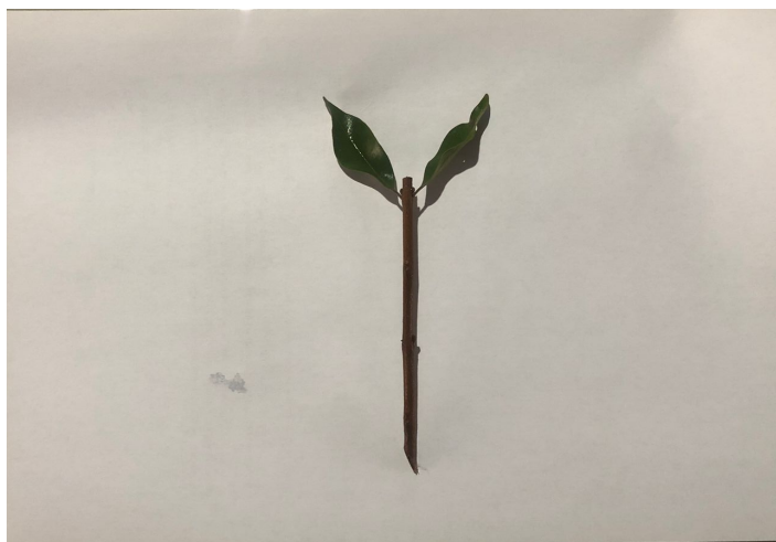
Figura 4 - Estaca de uvaia ( Eugenia pyriformis ).