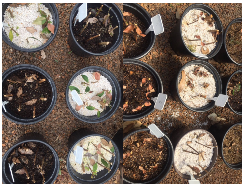
Figura 7 - Vasos plástico contendo estacas de Eugenia pyriformis em diferentes substratos e concentrações de AIB.

Aos 60, 90 e 120 dias foi avaliado sobrevivência das estacas, número de brotos, comprimentos de brotos, para as estacas coletadas no inverno. Para a época primavera foi constatado que todas as estacas morreram.