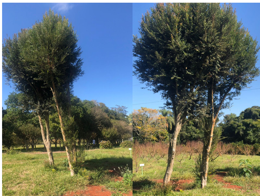
Figura 3 - Plantas adultas de uvaia ( Eugenia pyriformis ), usadas para coleta das estacas.

Para o experimento foram coletadas estacas semi-lenhosas de brotação rejuvenescida de plantas adultas produtivas de uvaia (Figura 3) em duas épocas: inverno (19 de julho de 2022) e primavera (17 de outubro de 2022). Durante a coleta as estacas foram acondicionadas em um balde com água para conservar a umidade. Essas estacas então foram preparadas com aproximadamente 10 cm de comprimento, mantendo na região apical duas folhas inteiras e realizado um corte em bisel em sua base (Figura 4).