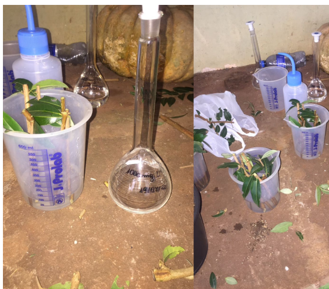
Figura 5 - Embebição das estacas de Eugenia pyriformis em AIB.

A base das estacas preparadas foram mantidas em água destilada e posteriormente imersas em AIB diluído em uma solução hidroalcoólica (Figura 5) por 30 segundos em distintas concentrações 0, 1000 e 5000 mg L -1 e então cerca de 1/3 do caule foi enterrado nos vasos com substrato perlita de granulação 10 mm e substrato comercial orgânico composto por turfa de Sphagno, vermiculita expandida, resíduo orgânico agroindústria classe A (casca de arroz torrefada), calcário dolomítico, gesso agrícola e traços de fertilizante NPK. Posteriormente o material foi colocado em estufa (Figura 6).